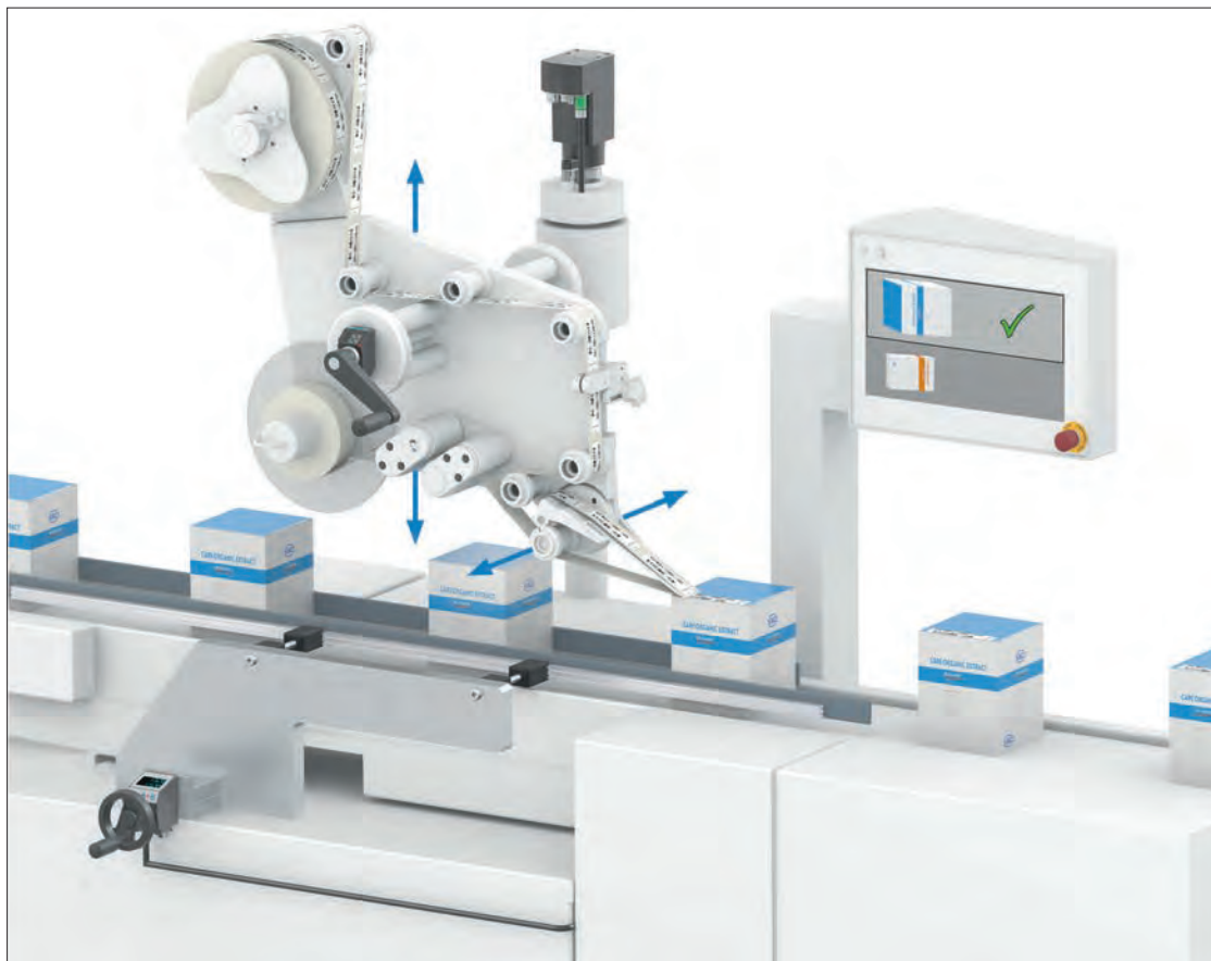
Formatverstellung über einer Etikettiermaschine in der pharmazeutischen Produktion.